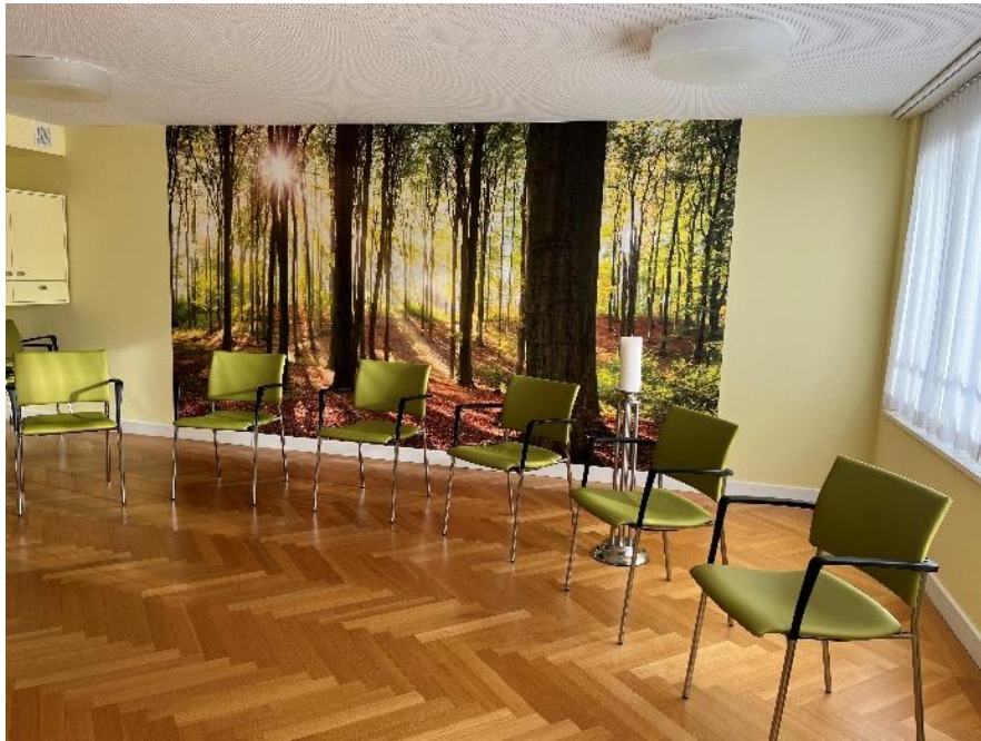
Raum der Stille