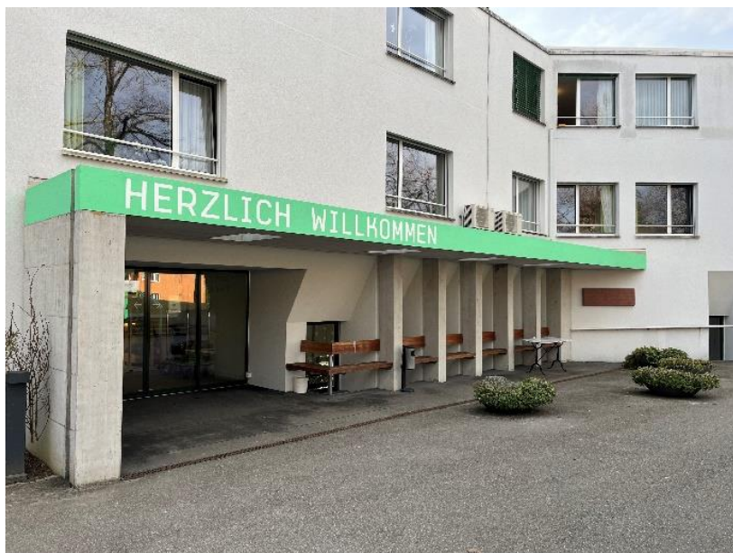
Eingang Alterszentrum Weihermatt

Die Redaktion der Hauszeitung Alterszentrum Weihermatt